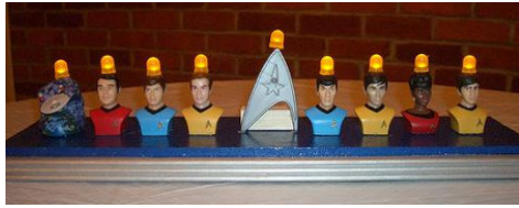
8 (ישיבה אוניווערסיטעט)